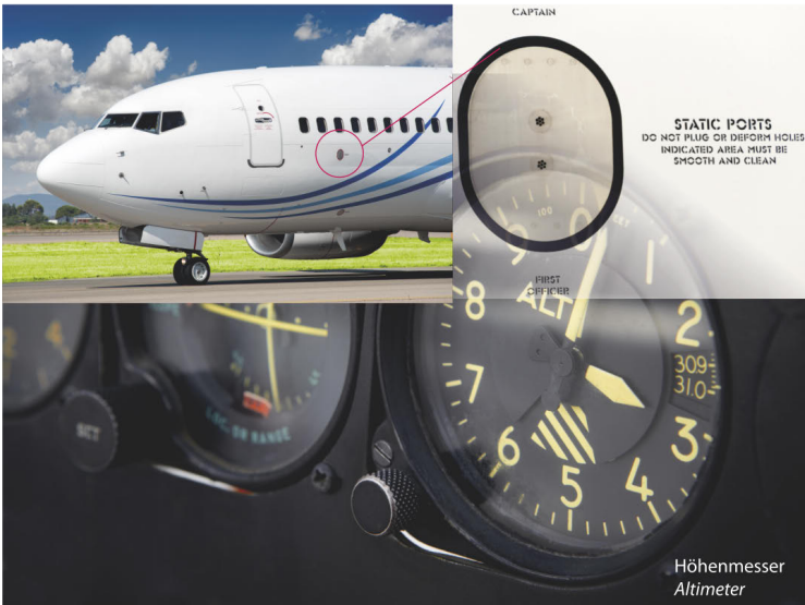
Abb. 1.3 Messstellen für den statischen Druck (engl.: Static Port) eines Passagierflugzeuges des Typs Boeing 737.

Weise – der höhere Umgebungsdruck den Strahl niedrigeren Drucks solange zusammendrücken, bis die Drücke wieder gleich sind, was selbstverständlich vollkommen absurd wäre. Im hier beschriebenen Fall steigen – infolge der relativen Energiezufuhr 1 – aufgrund der kinetischen Energie des sich im Strömungsfeld bewegenden Flugzeuges nur der Totaldruck p_t und der dynamische Druck q an. Der statische Druck p verändert sich nicht. In Kap. 4.8.5.7, Abb. 4.24, wird dieses Thema noch einmal wiederaufgenommen und ausführlicher physikalisch-mathematisch untermauert werden.